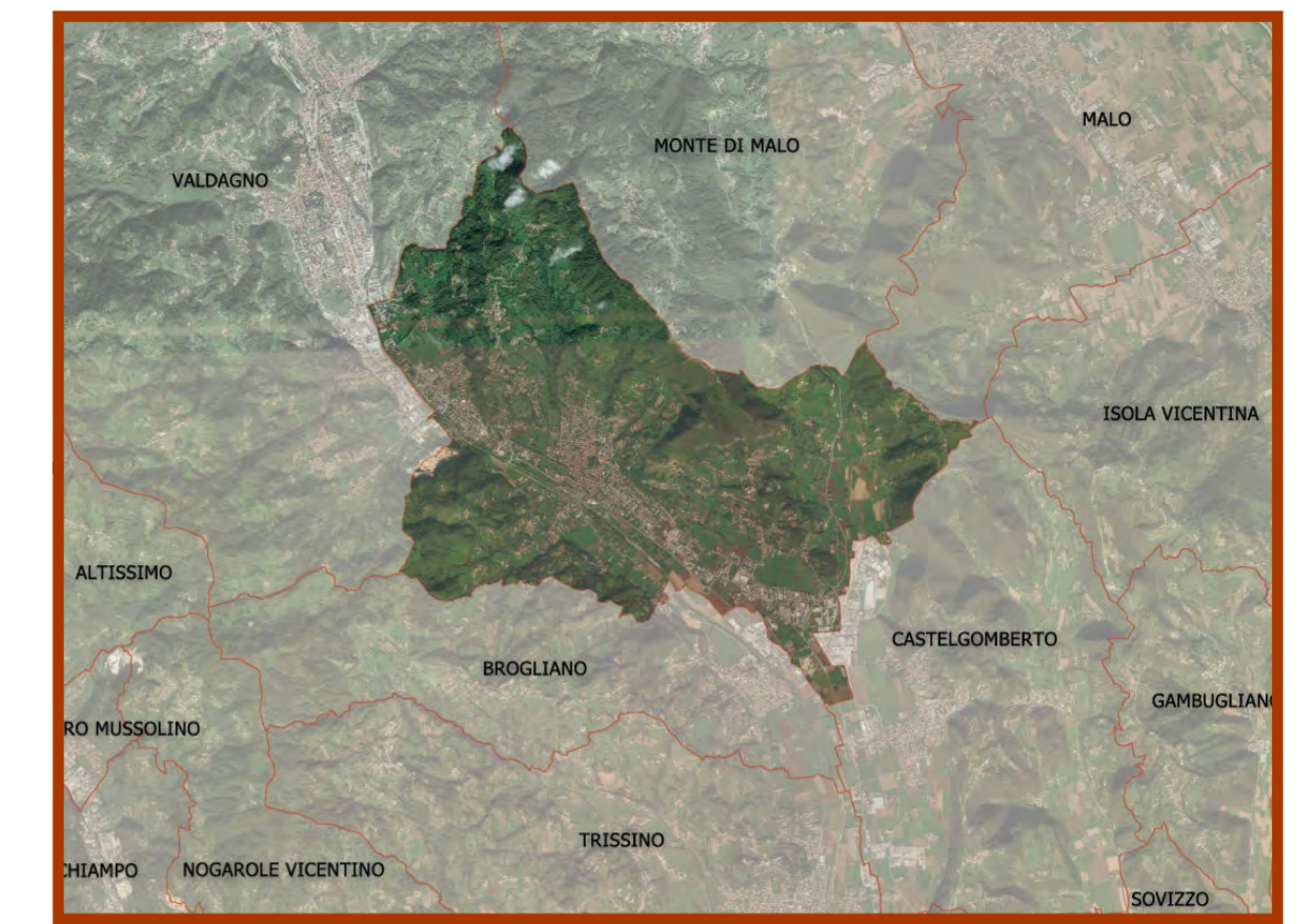
TAVOLA 5 CARTA DEL RISCHIO DA INCENDIO BOSCHIVO